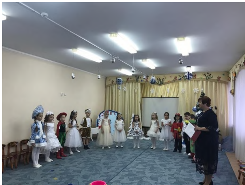
(Песня «Что такое Новый год»)

В сказке я живу. И знаю все на свете. Но скорей ответьте мне, что такое Новый год.