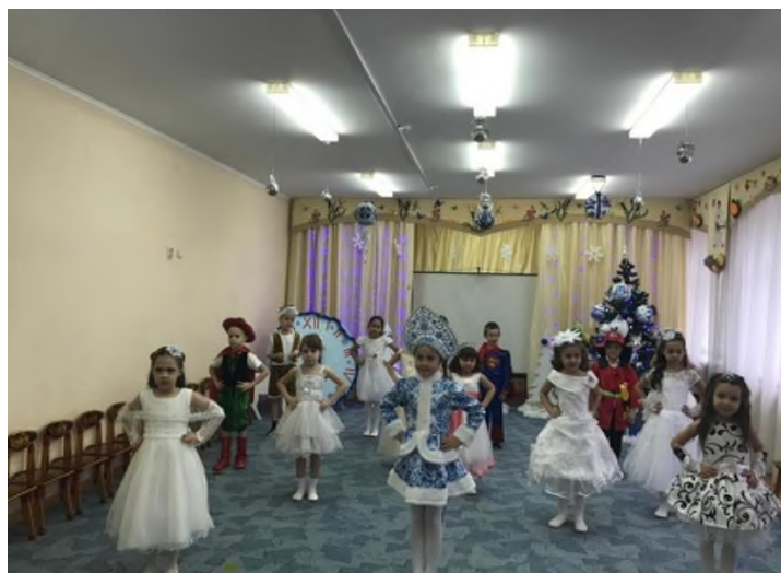
Снеговик и Зима раздают подарки для детей.